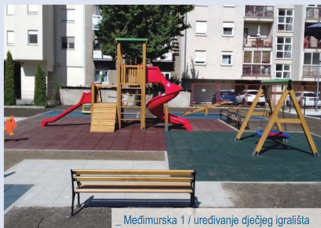
_ Međimurska 1 / uređivanje dječjeg igrališta