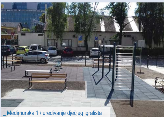
_ Međimurska 1 / uređivanje dječjeg igrališta