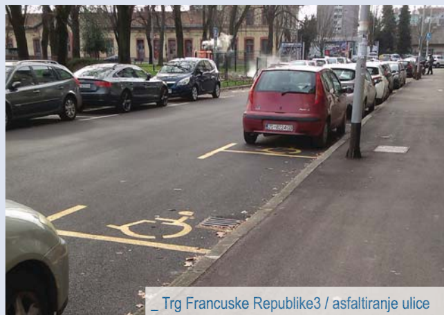
_ Trg Francuske Republike3 / asfaltiranje ulice