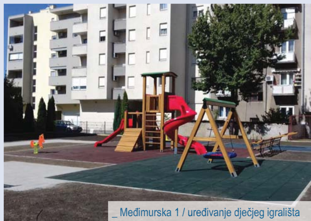
_ Međimurska 1 / uređivanje dječjeg igrališta