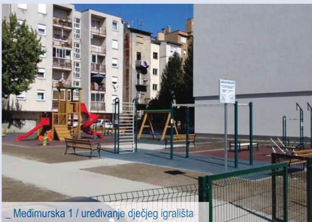
_ Međimurska 1 / uređivanje dječjeg igrališta