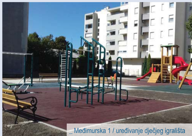
_ Međimurska 1 / uređivanje dječjeg igrališta