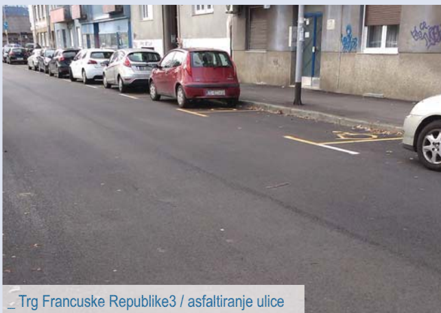
_ Trg Francuske Republike3 / asfaltiranje ulice