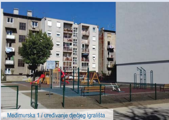
_ Međimurska 1 / uređivanje dječjeg igrališta